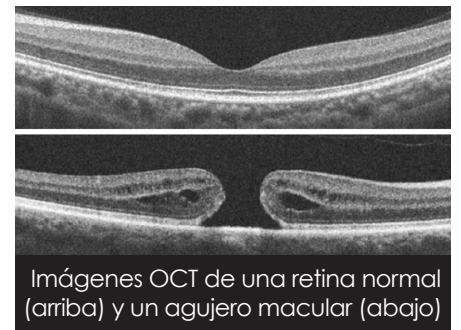
Imágenes OCT de una retina normal (arriba) y un agujero macular (abajo)

Los agujeros maculares suelen ser identificados por un oftalmólogo que utiliza un biomicroscopio de lámpara de hendidura. La angiografía con fluoresceína (una prueba con tinte para evaluar el flujo sanguíneo) suele realizarse para evaluar un agujero macular y descartar otras afecciones. La tomografía óptica coherente (OCT) es un tipo de prueba de imagen que se utiliza para obtener imágenes transversales de alta resolución de la mácula con el fin de confirmar el diagnóstico, excluir otras afecciones y controlar el agujero macular antes y después de la reparación quirúrgica.